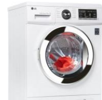
Es fällt einiges an Wäsche an ...