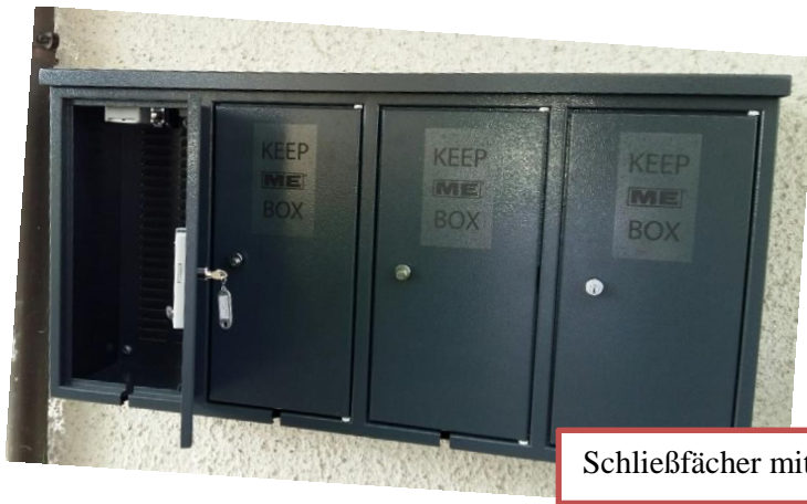
Schließfächer mit Ladegeräten