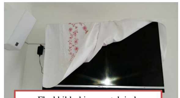
Flachbildschirm nostalgisch abgedeckt/versteckt. Wer weiß für was der no guat isch...