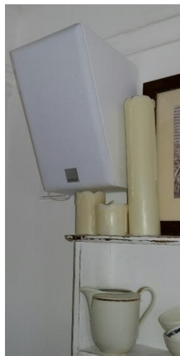
Boxen die kaum auffallen ...