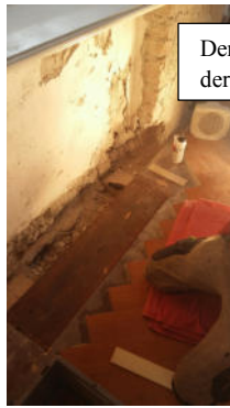
Der Schreiner/Restaurator beginnt in einem Raum mit der Ausbesserung der Böden.