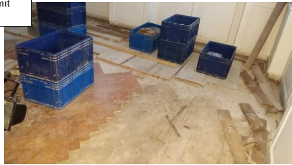
Im anderen Raum kommt der ursprüngliche Boden aus breiten Fichten-Dielen zum Vorschein.