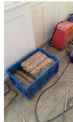
Eine eigene Nummer für jedes Stückchen Parkett.