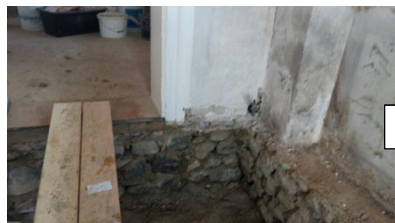
hier liegen die Grundmauern des Pfarrhauses frei.