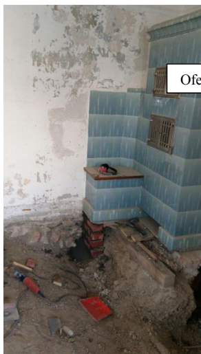
Ofenbauer Beigger untermauert die historischen Kachelöfen.